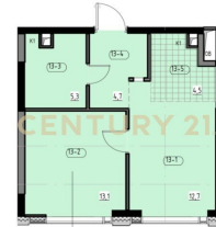
Общая площадь лота - 40,3 кв.м.