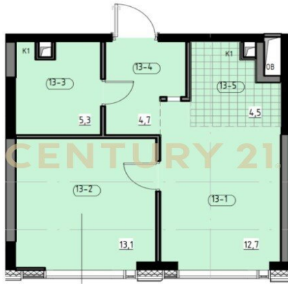
Общая площадь лота - 40,3 кв.м.

Москва, Бутырский, Бутырский, Огородный проезд, 4/2