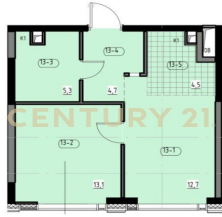
Общая площадь лота - 40,3 кв.м.

Москва, Бутырский, Бутырский, Огородный проезд, 4/2