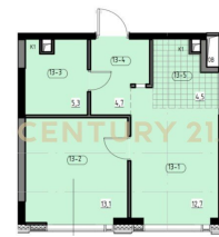
Общая площадь лота - 40,3 кв.м.

Арт. 136673518 Видовая евродвушка 40,3 м 2 на 34 этаже | Чистовая отделка | м. Бутырская 5 мин | Upside Towers Продаётся новый стиль жизни - евродвушка в ультрасовременном квартале небоскребов Upside Towers (Апсайд Тауэрс). Прекрасный вариант как для жизни, так и под выгодную аренду: высокая этажность, свет, инфраструктура город в городе. Переуступка. Ключи не позднее 30 декабря 2026 года. О КВАРТИРЕ — Квартира расположена на 34 этаже. — Общая площадь - 40,3 м 2 — Функциональная планировка: кухня-гостиная 17,2 м 2 + изолированная спальня 13,1 м 2 . — Высота потолков - 3,1 м — Дизайнерская отделка от ведущего бюро Valcon. — Панорамные окна выходят на юго-восток и имеют солнцезащитное напыление, вы получаете много естественного света без... >> https://www.century21.ru/nedvizhimos/prodaza-1-komnatnoi-kvartiry-403m2-3455-etaz