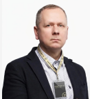
Удот Олег Эксперт

Помещение свободного назначения в Мурино (ул. Шоссе в Лаврики, 78 к1) – идеальное решение для вашего бизнеса! Готово к сдаче с 01.06.2026 Общая площадь: 115 м 2 на 1 этаже жилого дома с отдельным входом. В помещении сделана предчистовая подготовка (white box+санузел). Технические характеристики:Высота потолков: 3,0 м Электричество: 15 кВт Удобное расположение рядом с Ozon и WB Условия аренды:Арендная плата: 115 000 руб./мес. + коммунальные услуги обеспечительный платёж 115 000 руб. Прямая аренда от собственника (ИП, без НДС) Возможны арендные каникулы Идеально подойдёт для мед. центра, стоматологии, мед. лаборатории ветеринарной клиники, пекарни, кафе, кондитерской, buty коворкинга, студии растяжки, йоги. Арт. 135613816 >> https://www.century21.ru/nedvizhimost/murino-arenda-svobodnoe-naznachenie-73m2-116-etaz