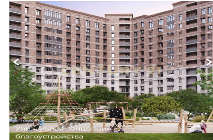
Уникальная концепция благоустройства