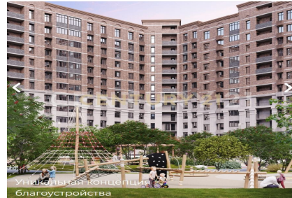
Уникальная концепция благоустройства