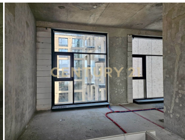
Пентхаус в ЖК Клубный Город На Реке Primavera