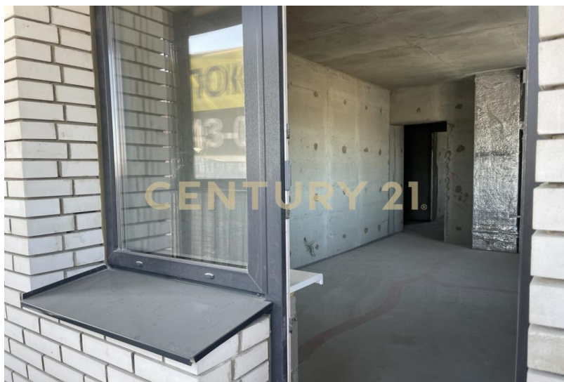
Планировка помещения №65