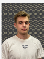
Федоренко Игорь Олегович Агент

Вашему вниманию ПСН 15 м 2 ! Отдельный вход, есть возможность разместить вывеску на фасаде, трафик от Wildberries Характеристики объекта: ■ Этажность – Первый этаж ■ Общая площадь - 5 м 2 . ■ Высота потолка - 4 м. ■ Два отдельных входа Коммуникации: ■ Электрическая мощность – 5 Кв/ч (возможно увеличение). ■ Канализация, система вентиляции. ■ Состояние объекта – Косметический ремонт ■ Коммунальные платежи не включены в стоимость ■ Налогообложение – УСН Оперативный показ! Все готово к заключению договора аренды! Звоните! Арт. 120140925 >> https://www.century21.ru/nedvizhimost/arenda-svobodnoe-naznachenie-15m2-17-etaz