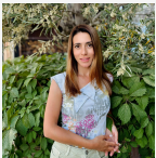
Королева Лиана Агент

удобный подъезд ровный рельеф 800 метров от трассы М2 асфальтированная дорога 800 метров до места врезки газовой трубы в 150 метрах не пересыхающая река Салгир участок сельхозназначения с возможностью перевода под промышленность по границе участка проходит высоковольтная линия 10кВт с возможностью подключения Арт. 117319201 >> https://www.century21.ru/nedvizhimost/117319201-prodaza-ucastka-57sot