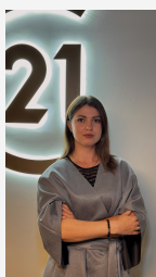
Бетина Вероника Эксперт

ВИД НА МИЛЛИОН, ЗАКАТЫ В ПРИДАЧУ 3 комнаты + большая кухня-гостиная | 91,69 м 2 | ЖК «Паруса» | 22 млн ₽ (торг обсуждаем) Финский залив — прямо из окна. Закаты, водная гладь, простор — каждый день как открытка. Продажа редкой по планировке и расположению квартиры — с тремя изолированными комнатами и просторной кухней-гостиной, которую можно превратить в сердце дома. Что здесь важно: • Три полноценные комнаты — детская, спальня, кабинет — всё уместится. • Большая кухня-гостиная — 16,9 м 2 с выходом на лоджию • Два санузла, лоджия, потолки почти 2,9 м — и всё это на 14-м этаже. • Косметика от застройщика — а значит, не платите за чужие вкусы, а делаете ремонт под себя. Где: Южно-Приморский район — чистый воздух, зелень, дом на... >> https://www.century21.ru/nedvizhimost/prodaza-3-komnatnoi-kvartiry-9169m2-1424-etaz