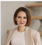
Качура Халида Эксперт

https://www.century21.ru/nedvizhimost/prodaza-2-komnatnoi-kvartiry-605m2-615-etaz